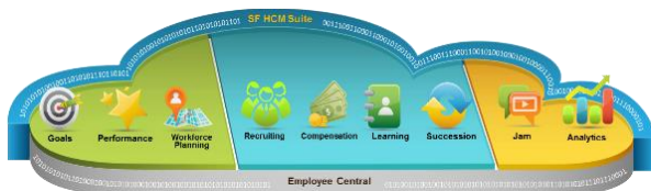
SF HCM Suite - Übersicht

Mit strategisch ausgerichteten Lösungen unterstützt und optimiert SAP SuccessFactors Ihre Personalprozesse nachhaltig. Oftmals in Kombination mit SAP On Premise - Systemen können einzelne Module der SF HCM Suite perfekt auf kundenindividuelle Bedürfnisse abgestimmt und kombiniert werden.